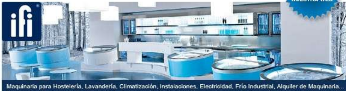
Maquinaria para Hostelería, Lavandería, Climatización, Instalaciones, Electricidad, Frío Industrial, Alquiler de Maquinaria...

“En Menalbar nos gusta innovar y adelantarnos a las necesidades de cada uno de nuestros clientes. Tanto en los proyectos más simples como en los más complejos.”